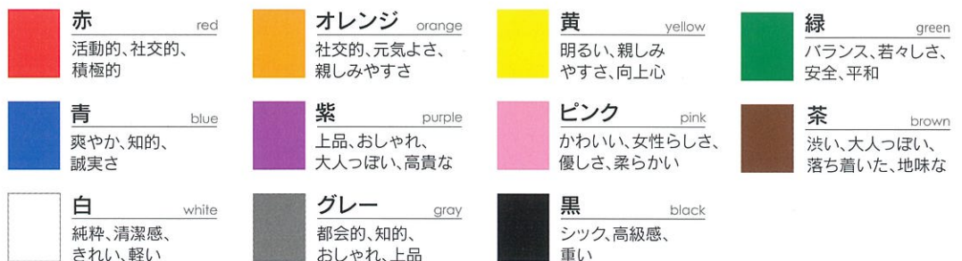
色のもつイメージ